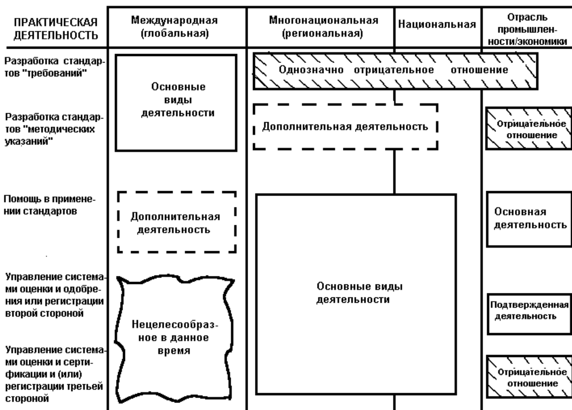
Рисунок С.1 — Матрица деятельности, связанной с применением стандартов на обеспечение качества