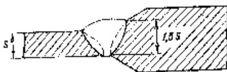
Рис. 2. Подготовка кромок патрубков арматуры при непосредственном соединении их с трубами

Во всех случаях, когда специальная разделка кромок патрубка арматуры выполнена не в заводских условиях, а также когда толщина свариваемой кромки патрубка арматуры превышает 1,5 толщины стенки стыкуемой с ней трубы, соединение следует производить путем варки между стыкуемой трубой и арматурой специального переходника или переходного кольца.